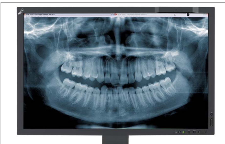
Die neueste Generation eines Befundmonitors Klasse B.

Abkürzungen: 6 j = mindestens alle 6 Jahre; 3 j = mindestens alle 3 Jahre; j = jährlich; w = mindestens wöchentlich