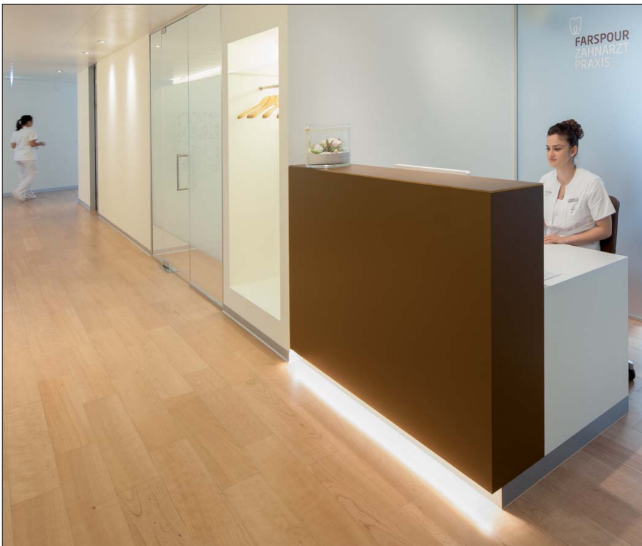
Ausgewogener Mix aus Klarheit, Wärme, Grosszügigkeit und durchdachten Akzenten.