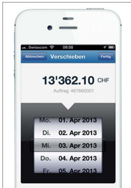
Auszahlungs-App «Crediflex»: Liquidität ferngesteuert.

In Zahnarztpraxen, die mit der Zahnärztekasse AG zusammenarbeiten, ist die Digitalisierung des Kreditmanagements weit fortgeschritten. Jetzt profitieren diese auch von einer mobilen Anwendung, die im Zusammenhang mit der Steuerung der Liquidität neue Perspektiven erschliesst.