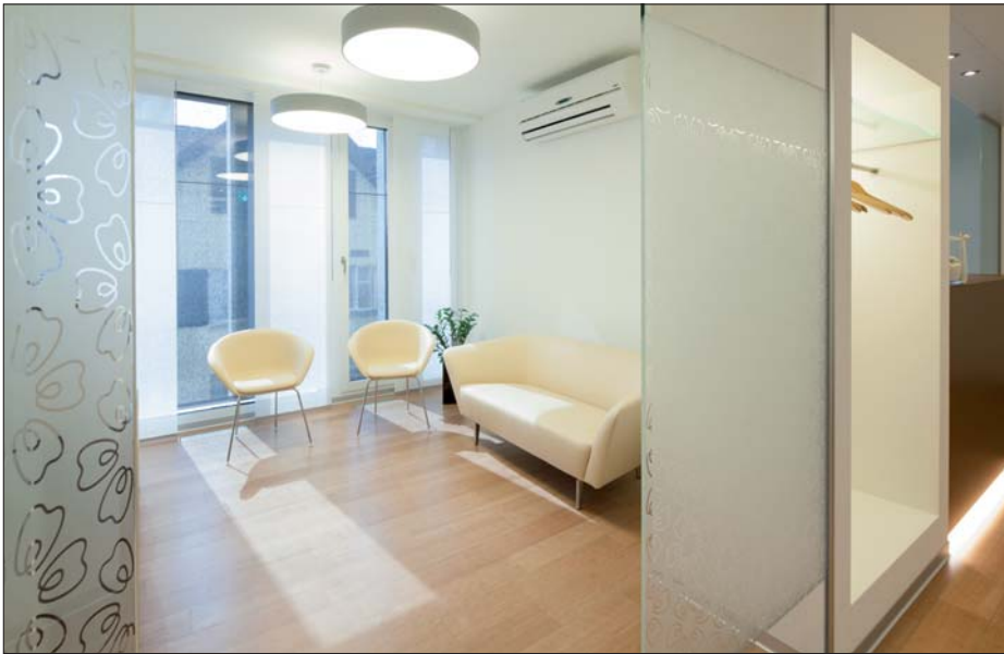
Das Warten als angenehme Erfahrung: bequem, hell, entspannt.

verständlichkeit gelten heute die Standards wie ein durchgehendes Hygienekonzept, die vollständige elektronische Vernetzung der Praxis oder die schnelle Anpassung des Angebotes an die Bedürfnisse der Patienten. Was dabei aber nicht vergessen sein soll, ist die «Verpackung» von all diesen technischen Notwendigkeiten. Sie bestimmt wie Ihr Patient die Praxis wahrnimmt, und in Erinnerung