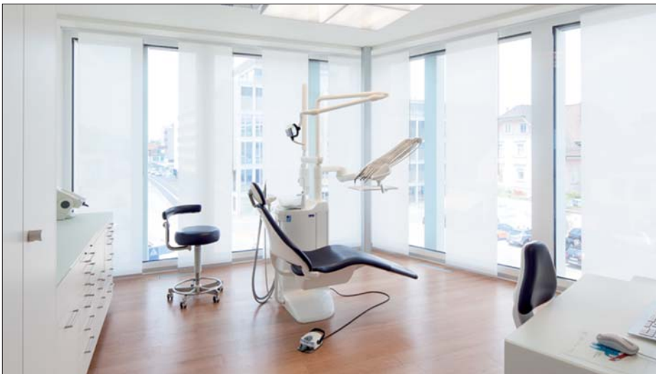
Viel Platz und Tageslicht für wohltuende Behandlung.

behält. Das Schaffen einer wohltuenden Stimmung, welche die Patienten vom Empfang über Toilette und Wartezimmer bis in die Behandlungsräume begleitet, ist dabei wesentlich. Gut ausgewogene Verhältnisse zwischen verwendeten Materialien, Farben, Oberflächen, Beleuchtung und Formen bilden die Basis für den Einsatz moderner Multimedia-Technik: Individuell wählbare Musik-